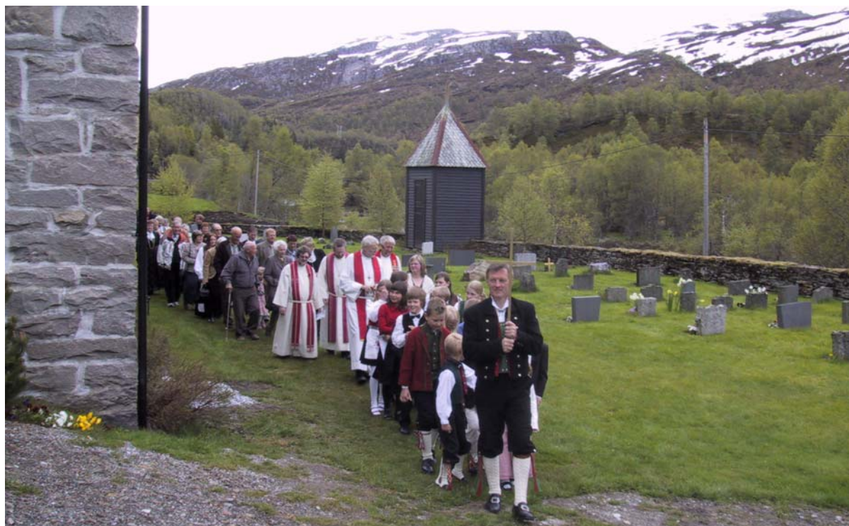
Etter gudstenesta gjekk kyrkjelyden ut i prosesjon, og tok jamvel ein tur rundt kyrkja!