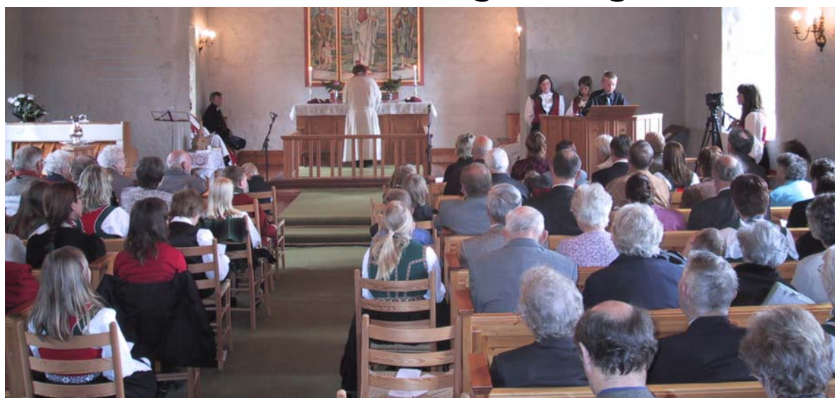
Borna tok og del i gudstenesta, her er nokon med i forbøna